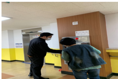
투표소 옥내소화전 점검

▶ 5년간 투·개표소 불량률은 평균 2.9% 였으며, '22. 제8회 지방선거 소방점검 시 불량률은 같은 해 제20대 대선 대비 -87% 를 나타냄.