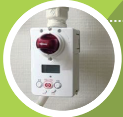
가스 타이머 꼭 설치