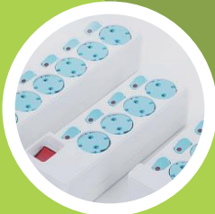
화재 방지용 콘센트 사용