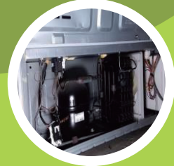
하부 전기장치실 먼지 제거