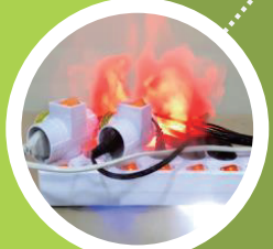
문어발식 코트 사용금지