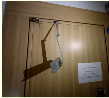
도어클로저 탈거 및 분리