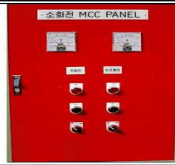
옥내소화전·스프링클러 펌프 등