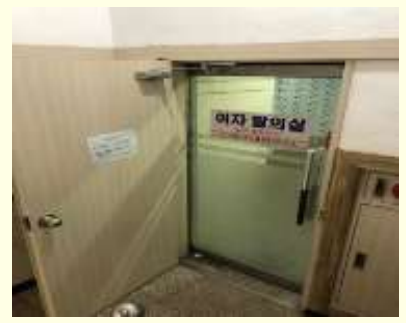
유리문 설치로 피난장애 발생