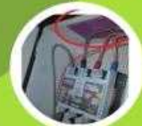
패치형 소화기 부착