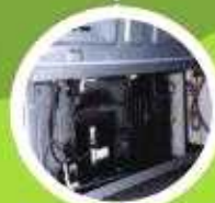
하부 전기장치실 먼지 제거