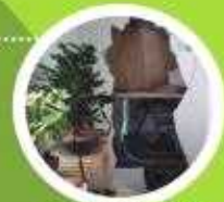
경량칸막이 앞 물품 적치 금지