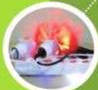
문어발식 코드 사용금지