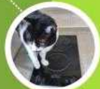
터치 조작부 커버 부착