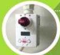
가스 타이머 록 설치