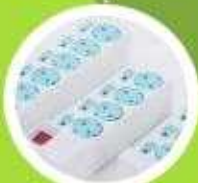
화재 방지용 콘센트 사용