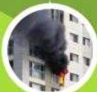
삼위기 이물질 청소