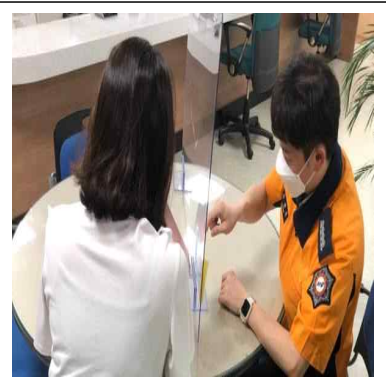
교육사진 - 3