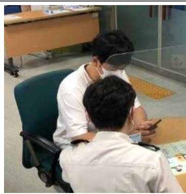
교육사진 - 2