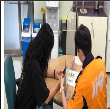
교육사진 - 1